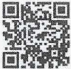
หลักการกฎหมาย การปรับปรุง ค่าธรรมเนียม ผู้ส่งออกข้าว