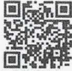
หลักการกฎหมาย การปรับปรุงเงื่อนไข ในหนังสืออนุญาต ให้ประกอบการค้าข้าว