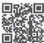
แบบรับฟัง ความคิดเห็น เพื่อจัดทำร่างกฎหมาย