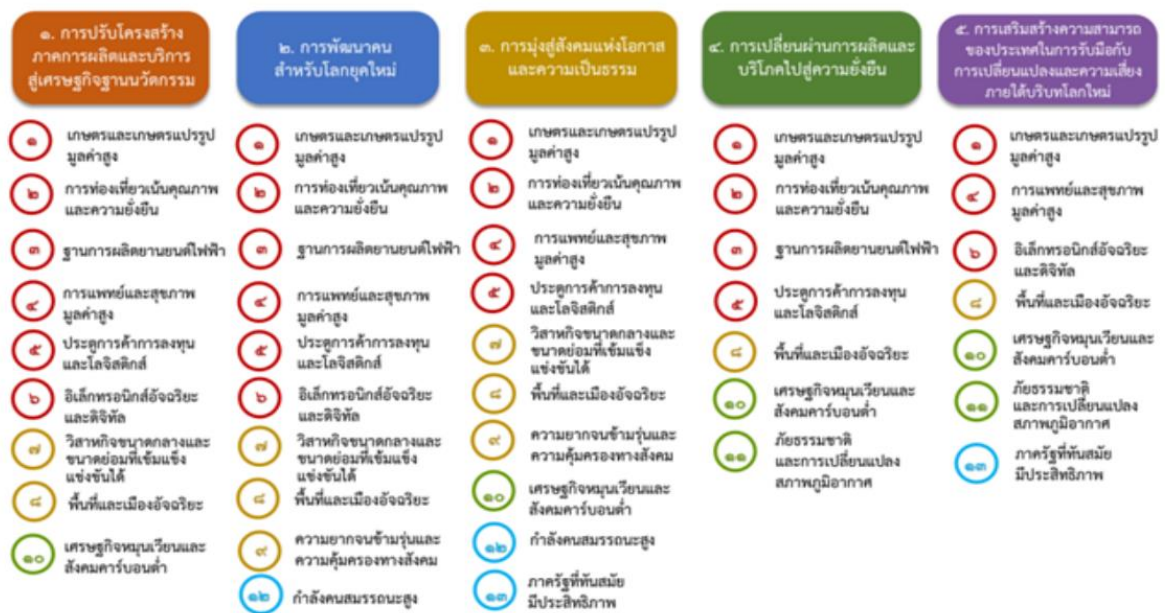
แผนภาพที่ ๓.๑ ความเชื่อมโยงระหว่างหมายเหตุการพัฒนาที่เป้าหมายหลัก

ความเชื่อมโยงระหว่างหมายเหตุการพัฒนาที่เป้าหมายหลักแสดงไว้ในแผนภาพที่ ๓.๑ โดยหมายเหตุการพัฒนาที่กำหนดขึ้นเป็นประเด็นที่มีลักษณะเชิงบูรณาการที่ครอบคลุมการพัฒนาตั้งแต่ในระดับต้นน้ำจนถึงปลายน้ำ และสามารถนำไปสู่ผลพัฒนาทั้งในมิติเศรษฐกิจ สังคม ทรัพยากรธรรมชาติ และสิ่งแวดล้อมไปพร้อมๆ กัน ทำให้หมายเหตุแต่ละประการสามารถสนับสนุนเป้าหมายหลักได้มากกว่าหนึ่งข้อ นอกจากนี้การพัฒนาภายใต้แต่ละหมายเหตุไม่ได้แยกขาดจากกัน แต่มีการสนับสนุนหรือเอื้อประโยชน์ซึ่งกันและกัน