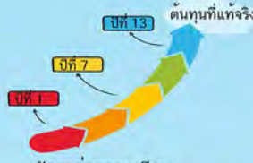
อัตราค่าธรรมเนียม