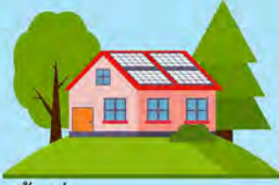
ท้องถิ่น