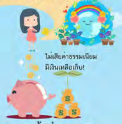
การยกเว้นค่าธรรมเนียม